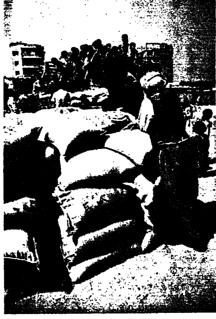
اكيس السكر في المسبخ